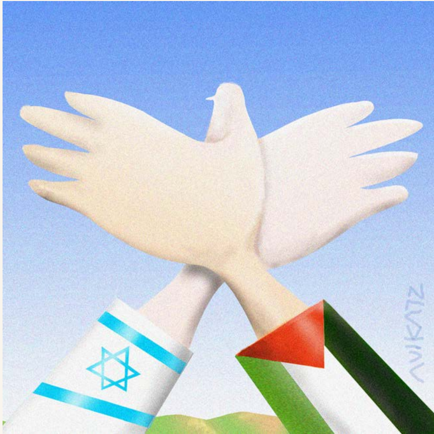
Le Proche-Orient © Avi Katz (Israël)