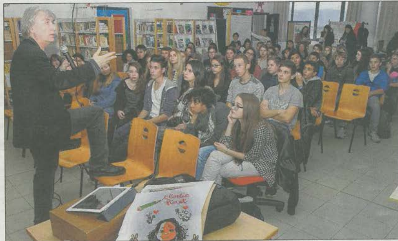
Les élèves de 4 e , 3 e , 2 de et 1 re , ainsi que quelques anciens ont pu dialoguer avec Plantu pendant plus de deux heures.

Lundi après-midi, les collégiens de 3 e , accompagnés de quelques camarades de 2 nde et 1 re , ont présenté leur projet aux élèves et aux professeurs, mais surtout à un invité un peu spécial : Plantu. Le dessinateur du Monde et président de l'association Cartooning for peace a avoué « avoir eu une petite boule dans la gorge en découvrant l'installation. C'était très émouvant de voir les témoignages de ces jeunes gens qui ont