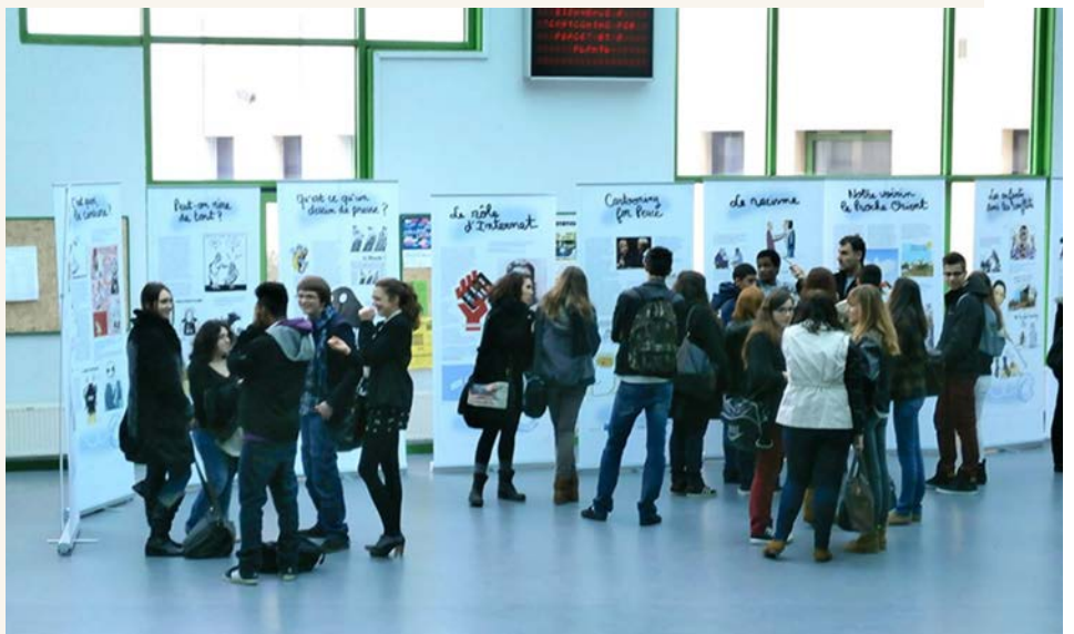
Lycée Charles de Gaulle Vannes Mars 2013