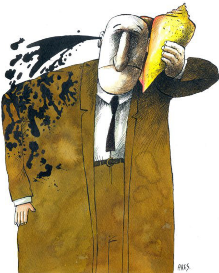
L'environnement © Ares (Cuba)