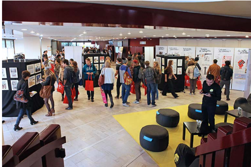
Tribunes de la Presse de Bordeaux Octobre 2013