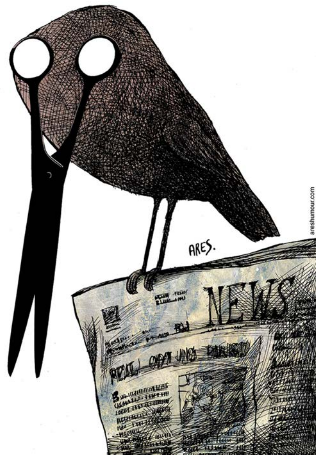
La presse © Ares (Cuba)