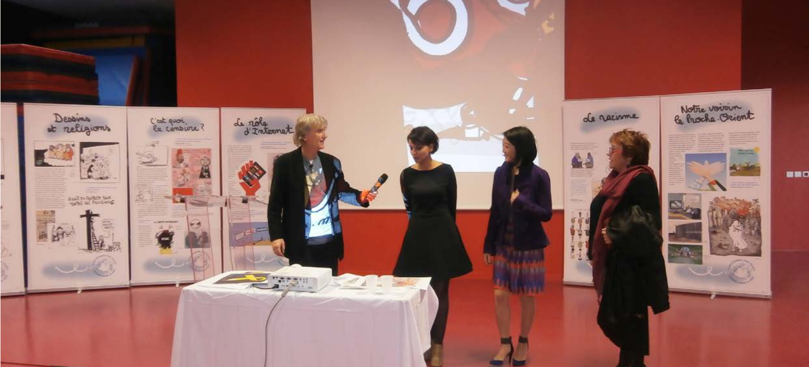
Rencontre avec les élèves du Collège Paul Bert (Malakoff) en présence des Ministres de l'Education et de la Culture, Najat Vallaud-Belkacem et Fleur Pellerin. Février 2015