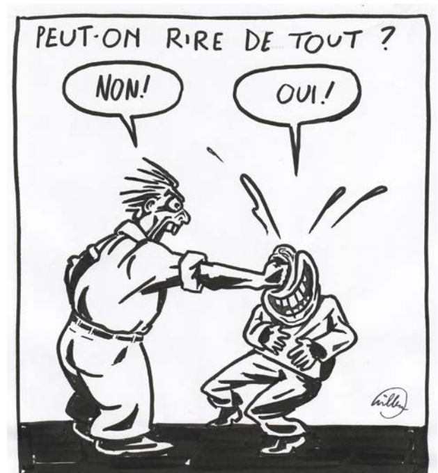
L'humour © Willem (France)