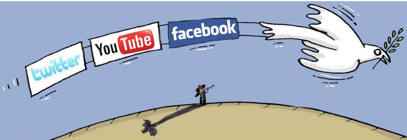
Les nouvelles technologies © Cécile Bertrand (Belgique)