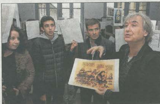
Le caricaturiste a détaillé certaines de ses œuvres évoquant la guerre.