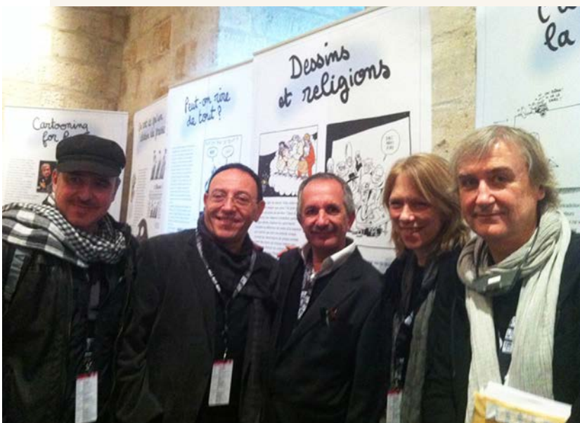
Les dessinateurs Boligán (Mexique), Kichka (Israël), Khalil (Palestine) Liza Donnelly (Etats-Unis) et Plantu (France) devant l'exposition itinérante, présentée au Forum d'Avignon en novembre 2013.