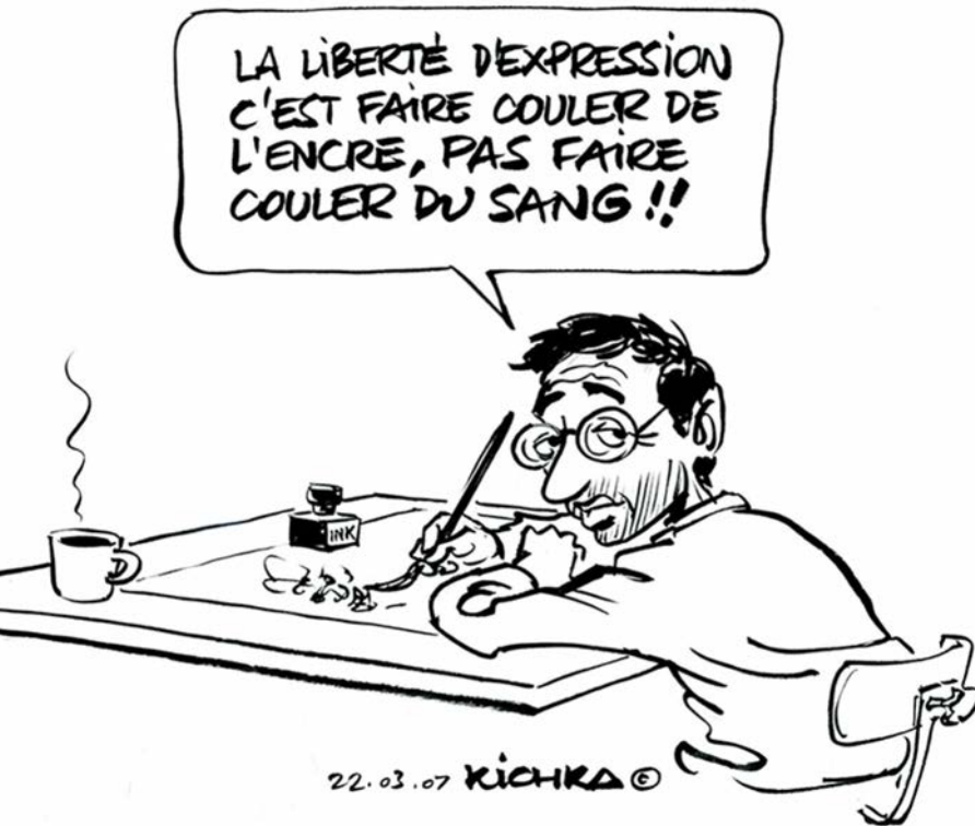
La Liberté d'expression © Kichka (Israël)