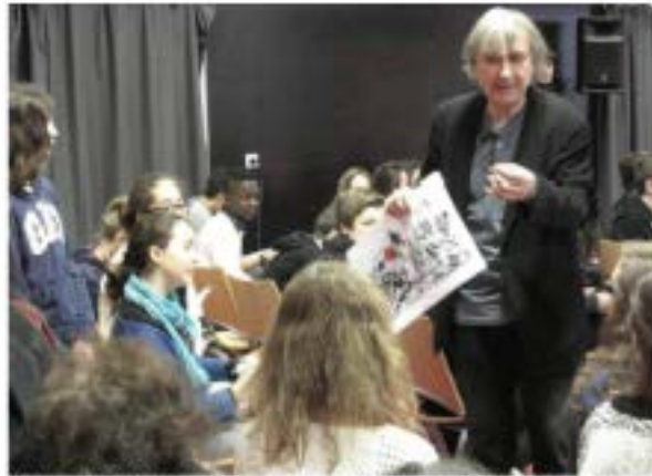
Malakoff, collège Paul-Bert. Hier, les ministres de l'Éducation nationale et de la Culture ont visité le collège Paul-Bert, où Plantu animait un atelier sur le dessin de presse. (30 auteurs français en 10 ans) : « Le boulot de dessinateur, c'est de s'amuser, mais aussi de rassembler les gens. C'est ce que le média cherche mais les chrétiens et les musulmans ont peur » (p. 118)