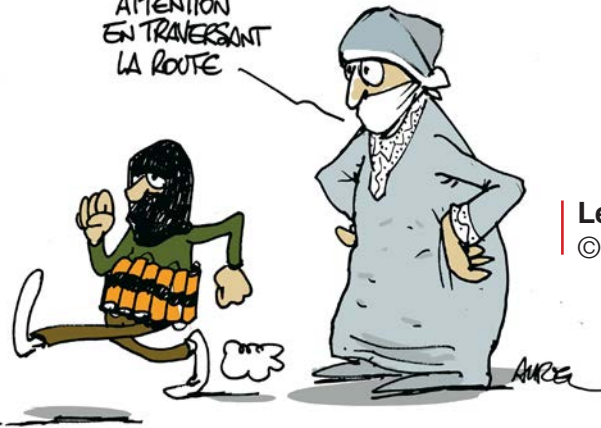
Les droits de l'enfant © Aurel (France)

ET FAIT ATTENTION EN TRAVERSANT LA ROUTE